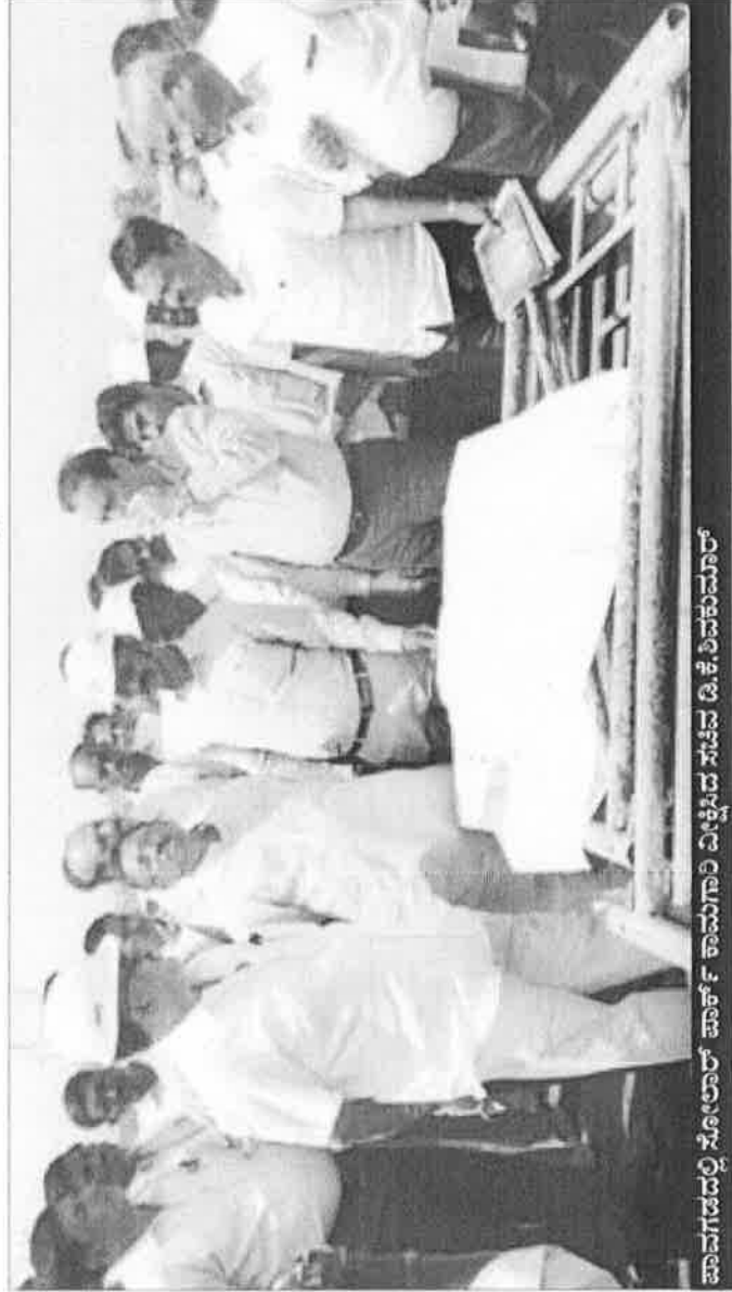
ಪಾವಗಡದಲ್ಲಿ ಸೋಲಾರ್ ಪಾರ್ಕ್ ಕಾಮಗಾರಿ ವಿಸ್ತೃತ ಮಾಡಿದ ಡಿ.ಕೆ.ಶಿವಕುಮಾರ್

■ ಸಚಿವ ಡಿಕೆಶಿಲಿಯಿಂದ ಕಾಮಗಾರಿ ಪರಿಶೀಲನೆ ■ 2018ರ ಸೆಪ್ಟೆಂಬರ್ ವೇಳೆಗೆ ಉಳಿದ ಸಾವಿರ ಮೆ.ವ್ಯಾ.ಸೇರ್ಪಡೆ