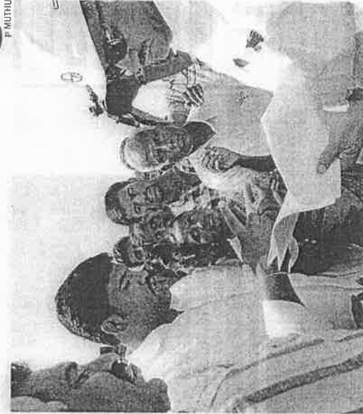
(Right) Energy minister DK Shivakumar meets farmers

vate. During the survey, officials had revealed that they would take over our land too. But during actual acquisition, our lands had been left out for no reason. Why can't the government take over our lands, too?"