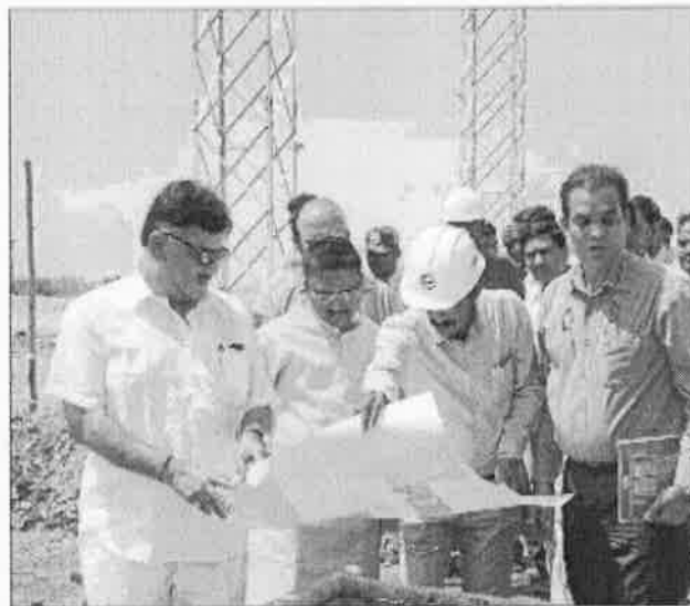
Energy Minister D K Shivakumar looks at the blue print of solar park near Thirumani in Pavagad taluk in Tumakuru district on Wednesday.

He said, "We had proposals from Belagavi, Kalaburagi and Raichur where people were ready to give us land at whatever price we quoted. But we have selected Pavagad. The government is also planning to set up industries here and generate employment here so that