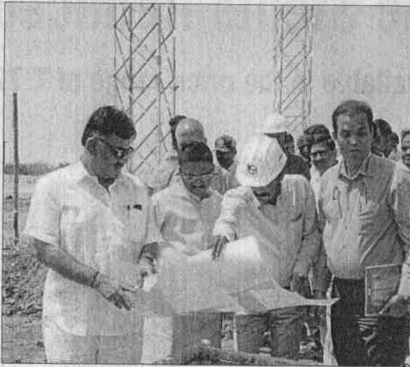
Energy Minister D K Shivakumar looks at the blue print of solar park near Thirumani in Pavagad taluk in Tumakuru district on Wednesday.

He said, "We had proposals from Belagavi, Kalaburagi and Raichur where people were ready to give us land at whatever price we quoted. But we have selected Pavagad. The government is also planning to set up industries here and generate employment here so that